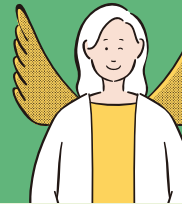
けあほーむはばたき