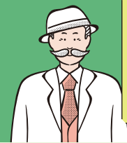
ひかりクリニック