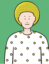
アユースグループ