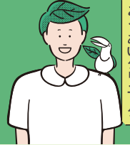
こうあいクリニック