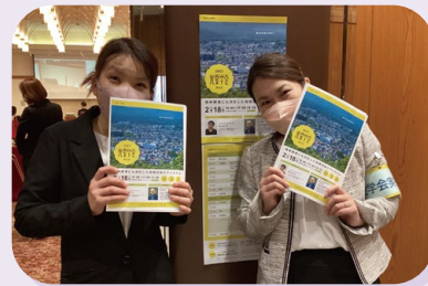
光愛学会のスタッフたち