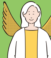
けあほーむはばたき