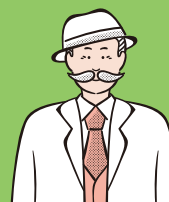
ひかりクリニック