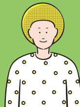
アユースグループ