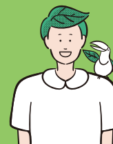
こうあいクリニック